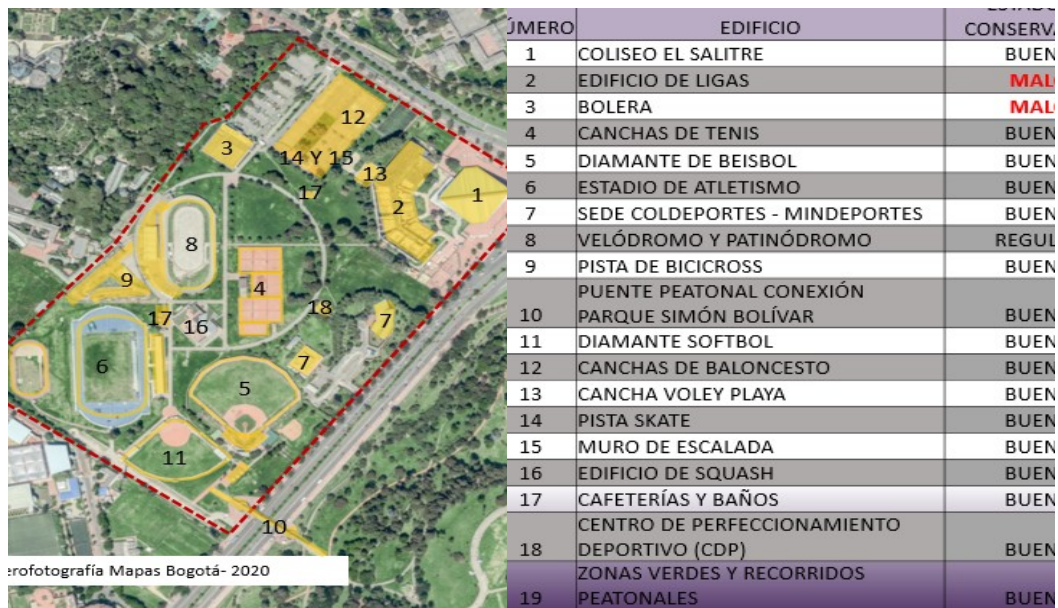
Imagen 4. Estado actual de los edificios y zonas verdes del complejo.

- Ser un ejemplo destacable de la obra de un arquitecto: Este inmueble es una de las obras destacadas de la firma de arquitectos Camacho y Guerrero y del ingeniero Zuleta, teniendo en cuenta que el coliseo tuvo un desarrollo importante a nivel estructural, lo que se puede observar en sus fotografías interiores.