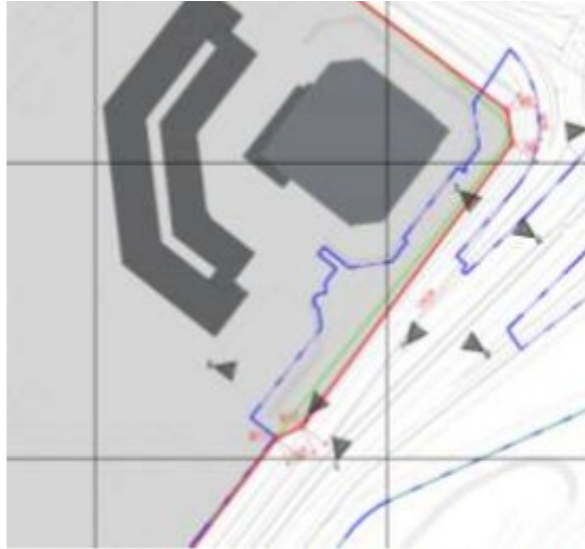
Fig. 6. Diseño Troncal Avenida Carrera 68.

El espacio público que se va a intervenir se puede ver en la Imagen 6 y es el área entre las líneas azul y roja (uno de los lotes producto de la subdivisión). El diseño de espacio público de esta zona responde a la Cartilla de Andenes de la Secretaría Distrital de Planeación y respeta los accesos vehiculares y peatonales existentes.